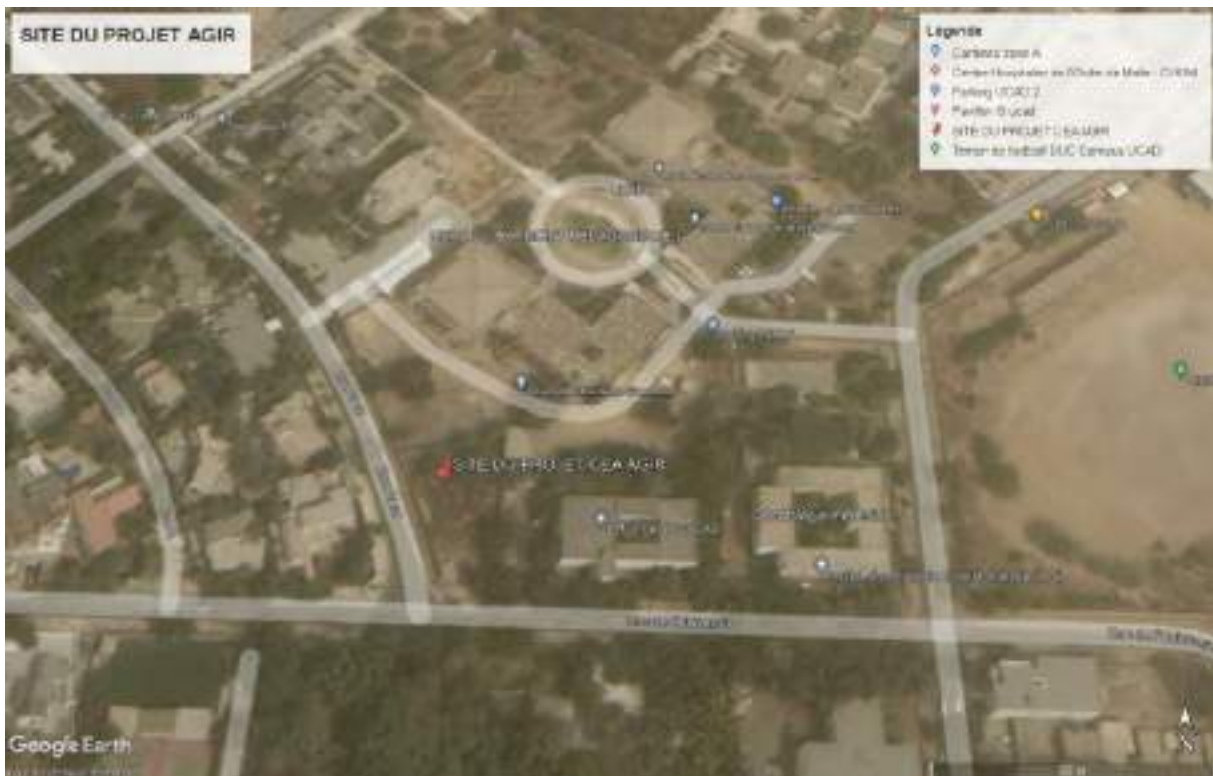
Carte 1 : Localisation du site du projet AGIR au sein de l'UCAD

Ce terrain étant la propriété de l'UCAD, il ne pourra faire l'objet d'aliénation. Par ailleurs, le terrain ne fait pas l'objet d'occupation ou d'activités économiques par les usagers ou par les opérateurs économiques. Conformément à la décision d'affectation, en cas de défaut de mise en valeur, il peut faire l'objet de désaffectation. La figure ci-dessous situe le projet dans la carte de la zone.